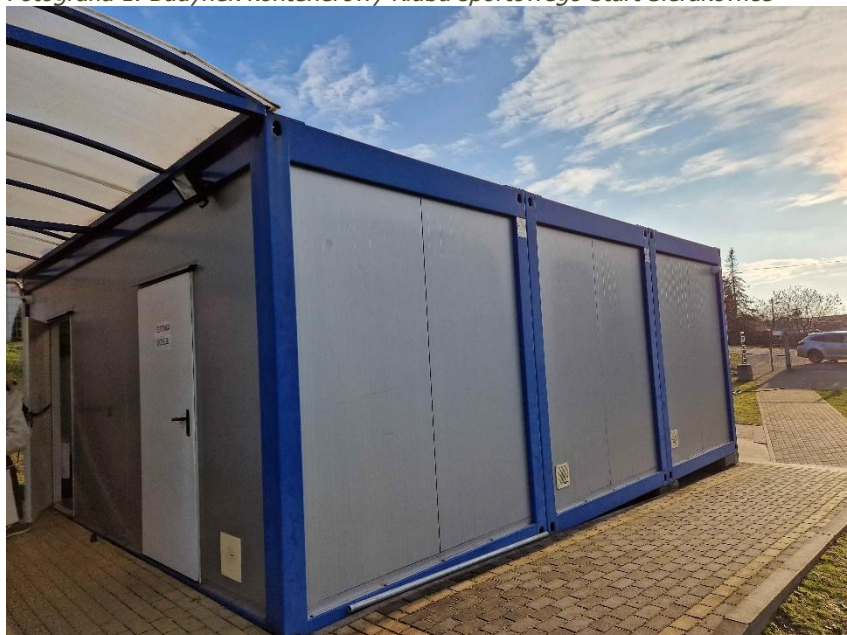
Fotografia 1. Budynek kontenerowy Klubu sportowego Start Sierakowice