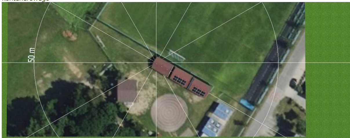
Rysunek 4. Proponowane miejsca rozmieszczenia modułów fotowoltaicznych na wiatrach obok budynku kontenerowego